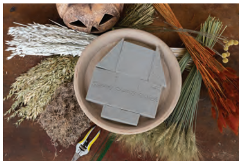
1. Na výrobu podzimní dekorace budete kromě květináče, podmisky, aranžovací hmoty a keramické dýně potřebovat také různé druhy obilovin a sušených květin. Všechny materiály i pomůcky si připravte tak, abyste je měli hned po ruce.