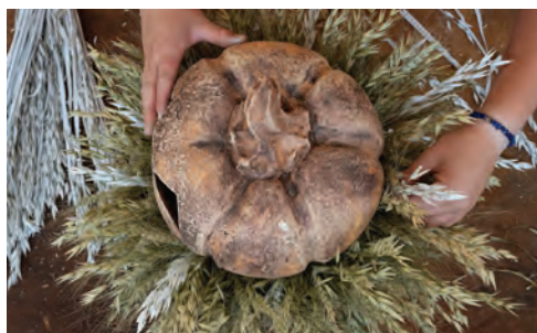
7. Kolem dýně vytvořte „límec“ z obilných klasů. Klasy postupně zapichujte do aranžovací hmoty ukryté pod výhony tilandsie. Mezi klasy zakomponujte také sušené květiny i barvený zaječí ocásek.