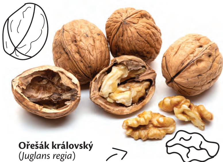
Ořešák královský ( Juglans regia )

Určitě mu promineme, že u nás není původní. Tento ořešák se hodí opravdu jen do velkých zahrad, kde vytvoří zajímavou dominantu. U odrůd je dobré sledovat, zda se jedná o kameňáky, papíráky, polopapíráky nebo křapáče. Tento pojem totiž vypovídá o pevnosti skořápky. Tu lze nejlépe rozlousknout u papíráku. Dostupné jsou už i odrůdy s karmínově zbarveným jádrem. V podrostu všech ořešáků neprospívají jiné rostliny kvůli látkám, kterými je ořešák odpuzuje.