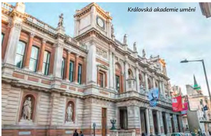
Královská akademie umění

James Sowerby byl britský přírodovědec, ilustrátor a mineralog. Jeho ilustrace jsou známé díky svým propracovaným detailům, použití výrazných barev a jednoduchým textům, což mělo za cíl oslovit širší publikum a zvýšit jeho zájem o přírodovědná díla. Během práce s minerály také vyvinul svou vlastní teorii barev.