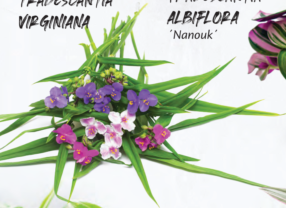
TRADESCANTIA ALBIFLORA 'Nanouk'