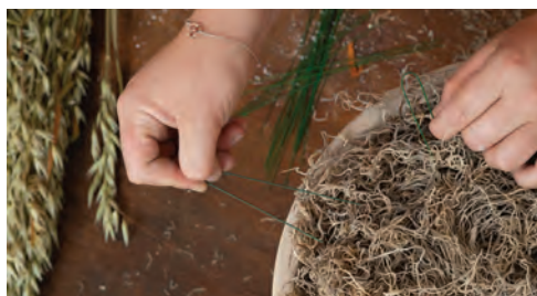
5. K aranžovací hmotě připevněte výhony tilandsie. S upevněním na několika místech pomohou háčky, které vyrobíte z asi deset centimetrů dlouhého drátku přeloženého v polovině délky.