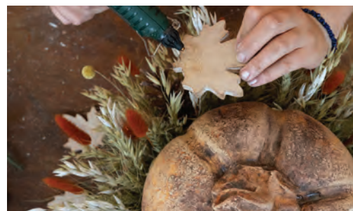
8. Nakonec tavnou pistolí přilepte různé floristické doplňky v podobě listů, miniaturních dýní a žaludů. Protože v dekoraci převažují přírodní barvy, volte doplňky v oranžových a cihlových podzimních odstínech.