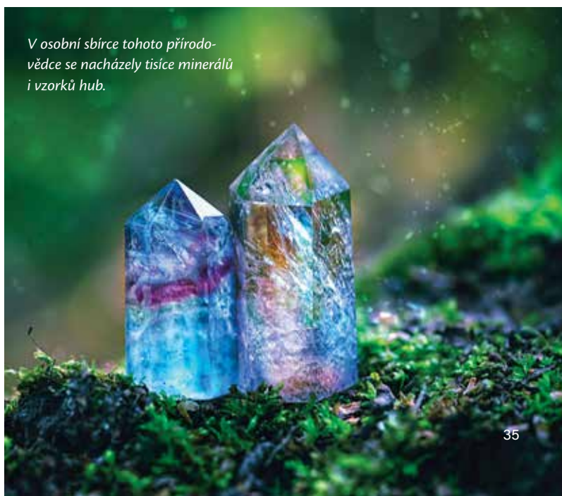
V osobní sbírce tohoto přírodovědce se nacházely tisíce minerálů i vzorků hub.