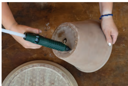
3. Nechte si nahřát tavnou pistolí a přilepte ke spodní části květináče podmisku. Zatímco květináč vytvoří podstavec, podmiska bude fungovat jako základ pro aranžování.