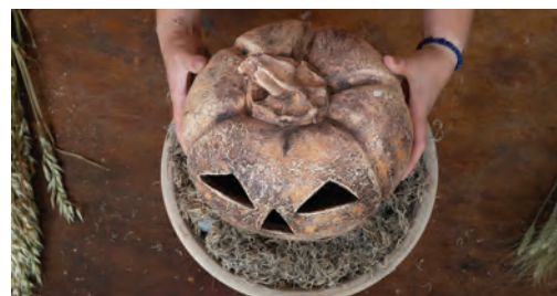
6. Na vrstvu z tilandsie usadíte keramickou dýně, která vytvoří dominantu celé dekorace.