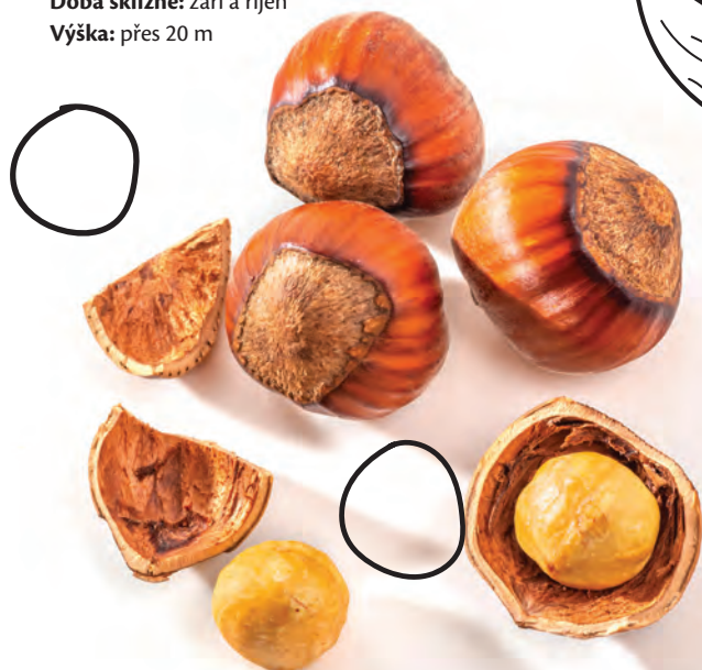
Líška obecná ( Corylus avellana )

I když planě rostoucí lísky snesou i velmi nekvalitní půdu, šlechtěným odrůdám raději dopřejte zeminu kvalitní a dobře propustnou. Tyto keře tvoří až čtyři metry širokou korunu, proto jim už při výsadbě dopřejte dostatek místa. U odrůd je nutné zjistit, zda se jedná o samosprašné nebo cizosprašné rostliny. V druhém případě je nutné na jeden pozemek vysadit více rostlin. Odrůdy lísek se liší nejen velikostí oříšků, ale i tvarem listenů kryjících skořápku nebo barvou.