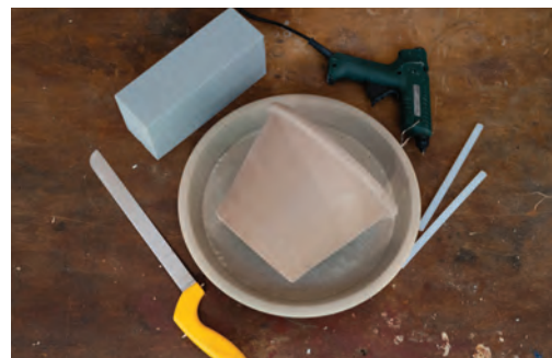
2. Než se pustíte do aranžování, připravte si květináč s podmiskou i tavnou pistolí včetně tyčinek. Květináč by měl mít průměr přibližně 20 nebo 30 cm, ale záleží na velikosti dýně, která představuje hlavní téma této dekorace.