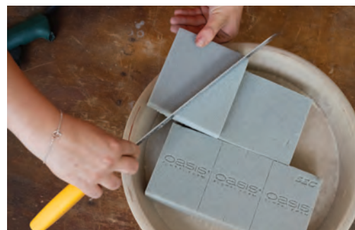
4. Podmisku vyplňte aranžovací hmotou. Menší výšky jednoduše nařežete pomocí nože s dlouhou čepelí. I hmotu můžete k podmisce připevnit tavnou pistolí.